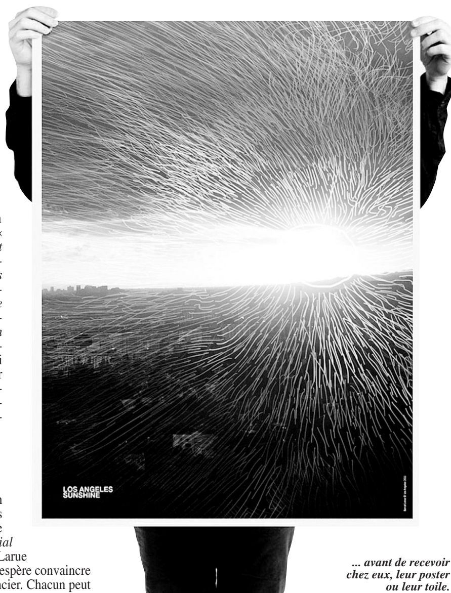
... avant de recevoir chez eux, leur poster ou leur toile.